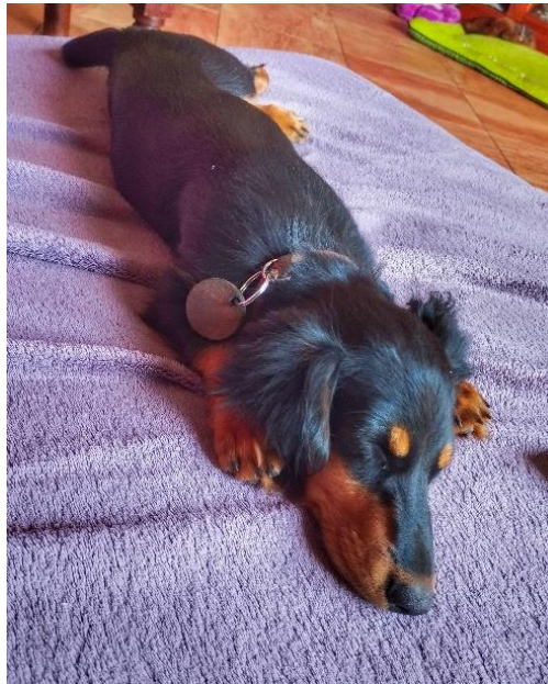
Bericht: G. Wilms und Bilder der teilnehmenden Dackelfreunde