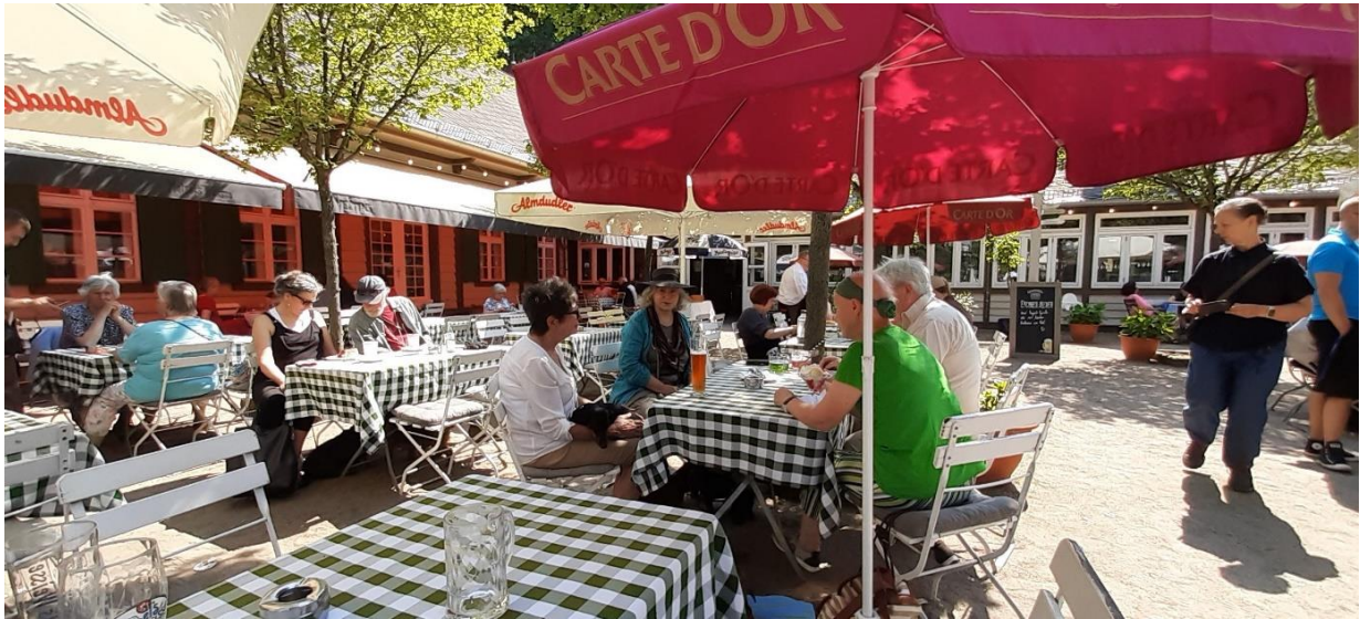
Ein rundum gemütlicher Dackel-Samstagnachmittag-Ausflug mit Freunden.